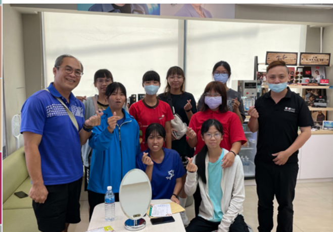
▲ 明基材料與小林眼鏡合作前往土庫工商進行配鏡活動

視光希望工程 2023 年度有 443 位學童進行申請，其中 2022 年度新合作的安置機構與學校單位提供的申請數翻倍，然而，在我們顧及更多學童視力問題的同時，卻發現了只有不到七成的申請學童會實際前往配鏡。經與家扶基金會展開密切的討論，才理解到這個落差來自於弱勢家庭與隔代教養的照顧困境。為了讓資源能更妥善受到運用，2024 年度將進行「配鏡追蹤機制」與「扶助個案的用眼環境檢視」二項延伸方案，透過現場勘查與檢視機制，讓我們更堅定地持續關注與改善弱勢學童的視力健康問題。