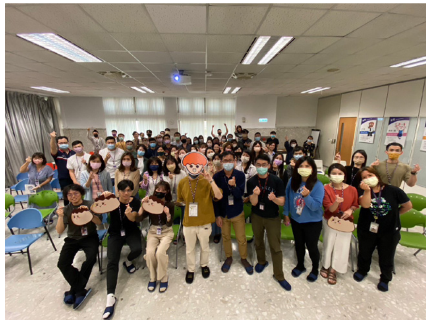
▲ 明基材料邀請知名 YouTuber 洋蔥於公司內部進行講座分享

自 2016 年起，明基材料便與研揚文教基金會攜手合作，每季於公司內部舉辦不同主題的畫展。透過這些展覽，提供同仁一個接觸各種藝術形式的機會，不僅可以放鬆身心，享受藝文氣質，亦間接激發同仁的創造力和想像力。在此計畫中，我們投入的經費已超過新台幣 20 萬元。