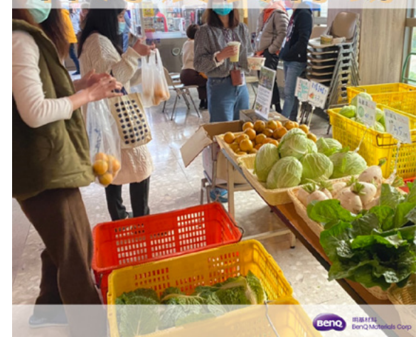
▲ 獲得台灣永續行動獎聯合國永續目標「SDG 2 消除飢餓」的銀級獎