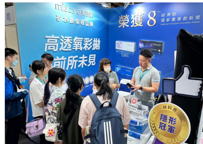
▲ 明基材料視力保健品牌美若康參與第四屆台灣驗光師年會

明基材料醫療包材品牌 Sigma 於 2023 年 10 月在振興醫院舉辦了一場精彩的活動，活動中分享了醫療滅菌包裝的設計與材料運用，以及 ISO 11607 法規的動態。同時，我們也解決了醫護人員針對滅菌袋包裝密度問題，提供了 75% 上限的規範，讓醫護工作更加順暢。這次活動不僅促進了行業交流，也為醫護工作提供了實用的解決方案。