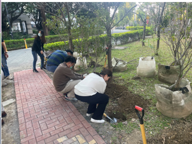
▲ 明基材料桃園廠區植樹活動：邀請高階主管共同參與