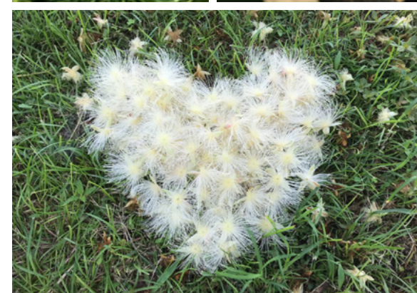
▲ 明基材料雲科廠區生態實際拍攝圖