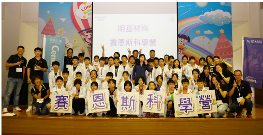
▲ 明基材料前往雲林在地國小舉辦賽恩斯科學營