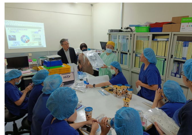
▲ Sigma 醫療包材與振興醫院進行產業交流活動